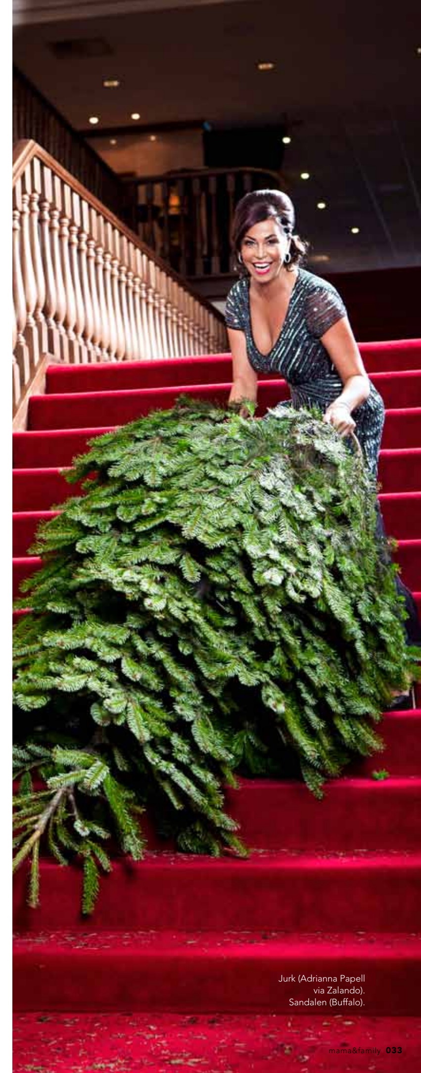
Jurk (Adrianna Papell via Zalando). Sandalen (Buffalo).